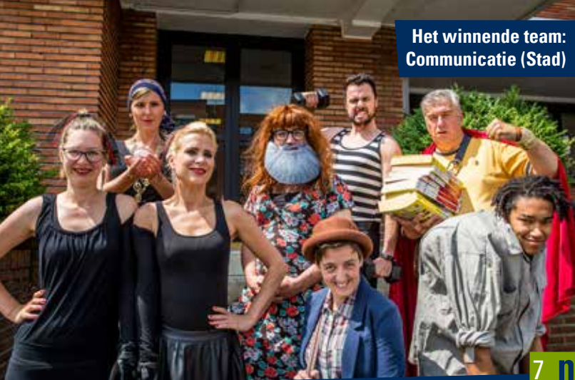
Het winnende team: Communicatie (Stad)