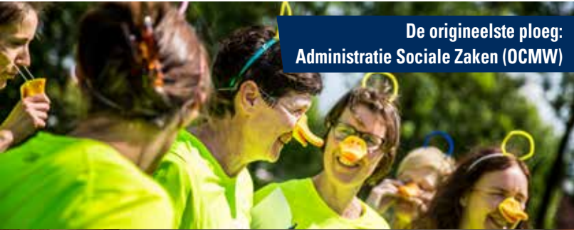
De origineelste ploeg: Administratie Sociale Zaken (OCMW)

In datzelfde nummer brachten we een artikel over burn-out. Eén van de kernwoorden in de tekst: bewegen. En daar hoorde een logische verwijzing naar het vorige artikel bij.